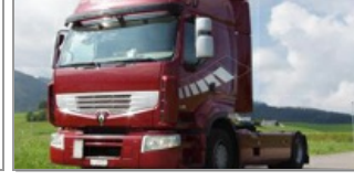
Renault Trucks'lar Trabzon'da balık ve fındık taşıyacak